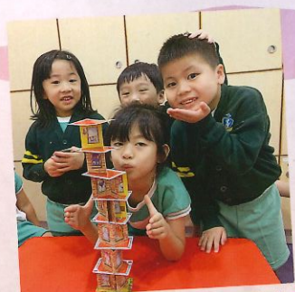
我們合力製造了6層高的大廈！