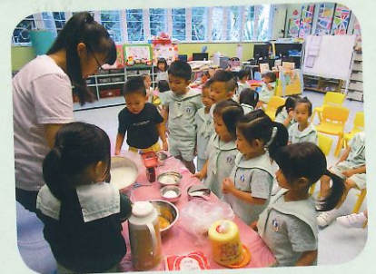
義工媽媽和我一起做蛋糕。