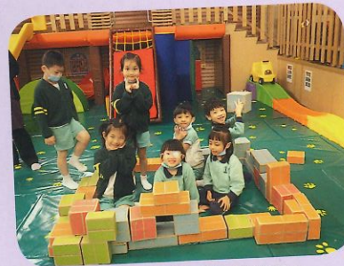
歡迎來到我們的紙磚城堡!