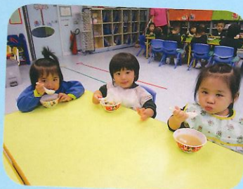
大家一起品嚐美味的食物!