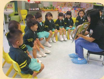
兒童專心地聆聽故事媽媽說故事。