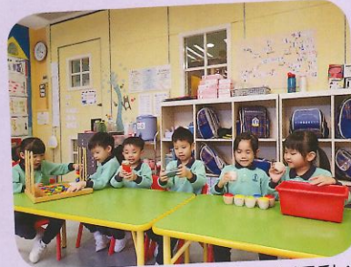
看我們很專心地進行探索活動!