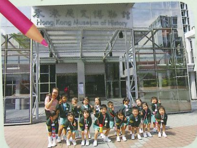
良善組到歷史博物館參觀。