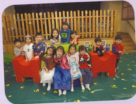
最開心的是有好朋友相伴。