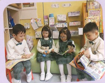
我們安靜地閱讀圖書。