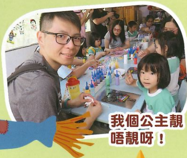
我個公主靚唔靚呀!