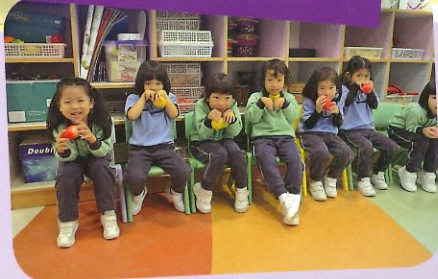
我們是可愛的小螞蟻。