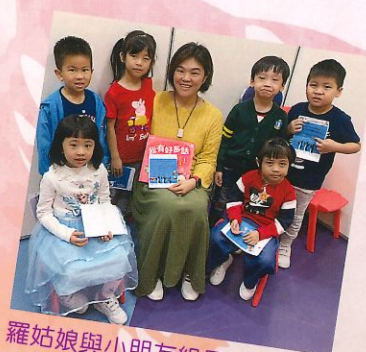
羅姑娘與小朋友組員！