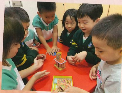
我們有耐心等待！ 到我啦！