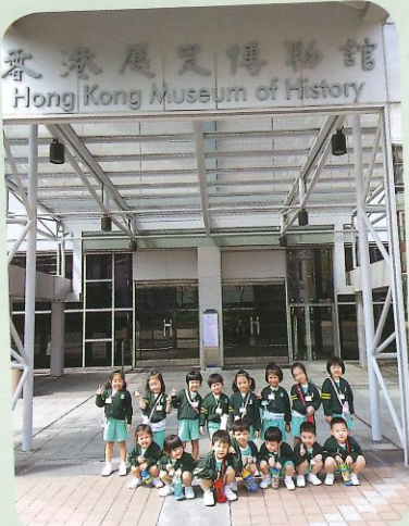
溫柔組到歷史博物館參觀。