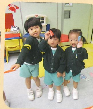
看誰的紙飛機飛得最遠!