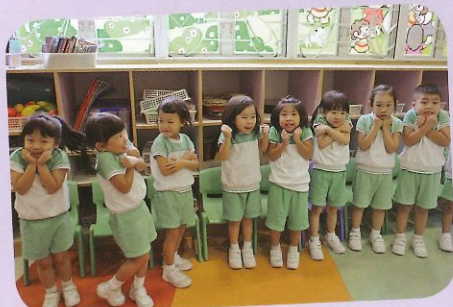
猜猜我們在扮演甚麼電器呢?