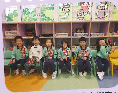
咚咚咚! 棒棒鼓的聲音多響亮!