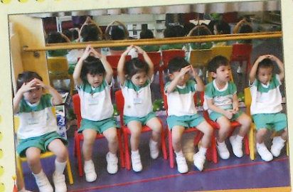
投入地朗讀兒歌《我的家》。