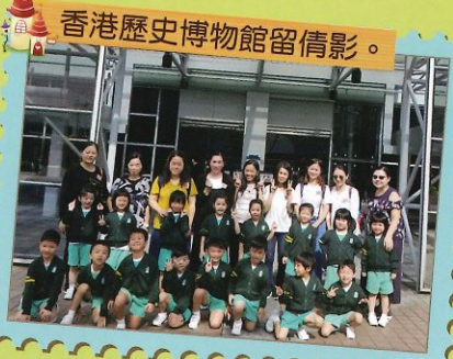
香港歷史博物館留倩影。