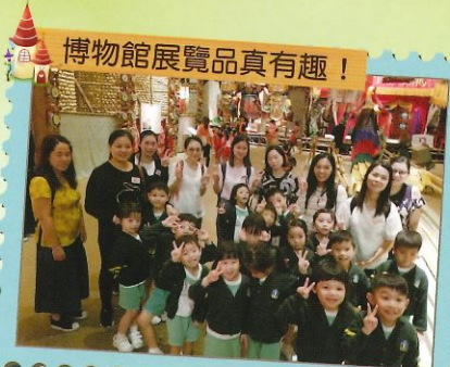
博物館展覽品真有趣！