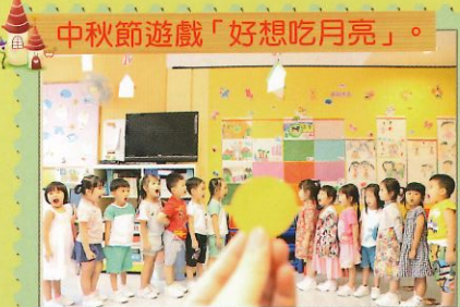
中秋節遊戲「好想吃月亮」。