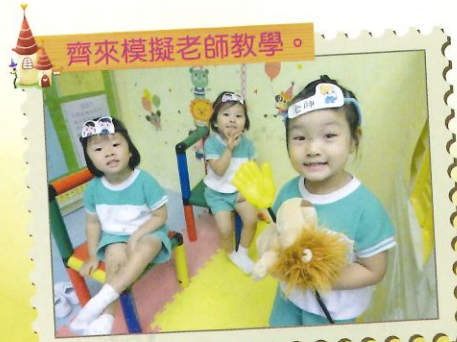
齊來模擬老師教學。