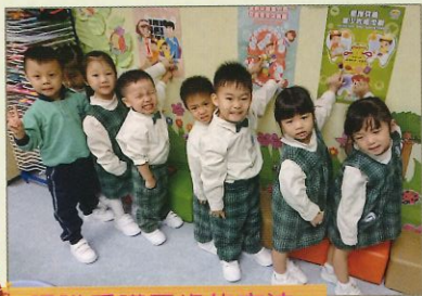
認識愛護牙齒的方法。