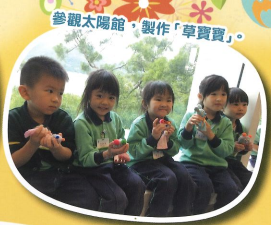
參觀太陽館，製作「草寶寶」。