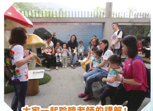
大家一起聆聽老師的講解!