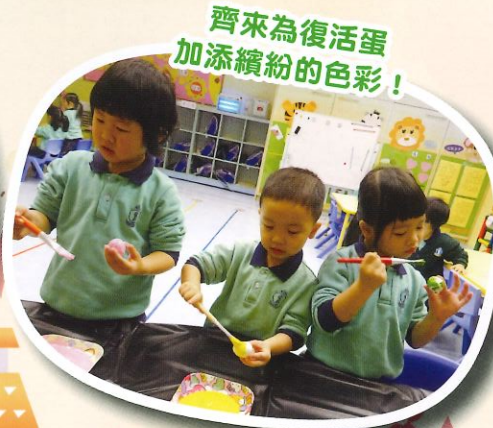
齊來為復活蛋 加添繽紛的色彩!