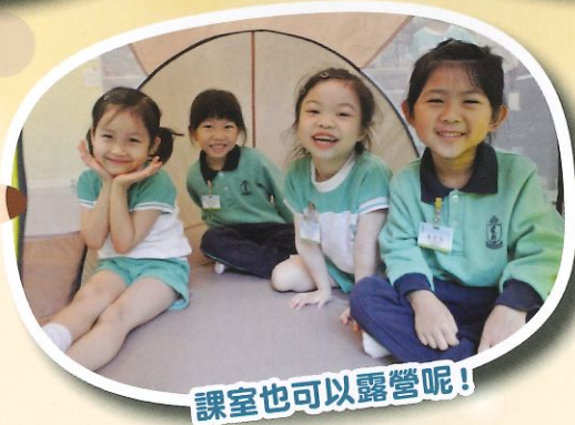
課室也可以露營呢！