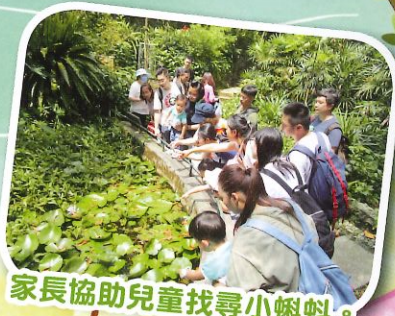
家長協助兒童找尋小蝌蚪。