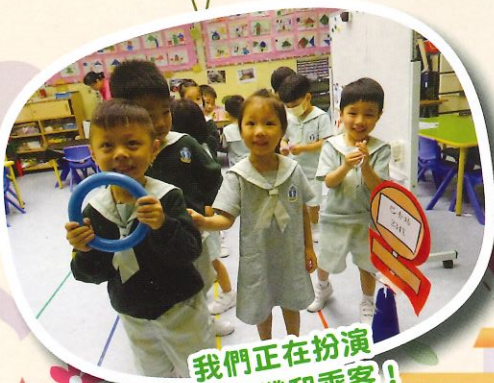
我們正在扮演 巴士司機和乘客!