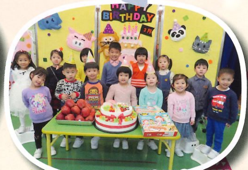
齊齊開心慶祝生日會。