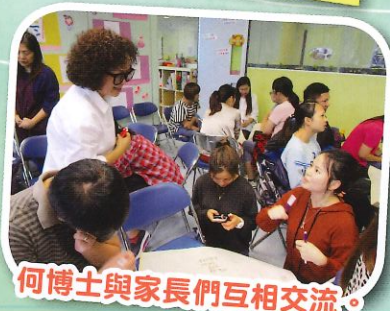
何博士與家長們互相交流。