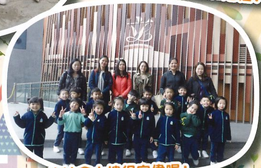
立法會大樓很宏偉喔！