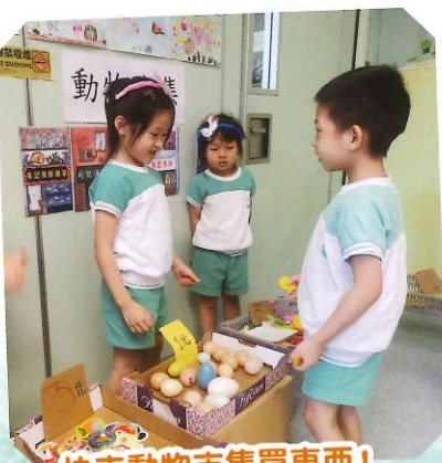
快來動物市集買東西!