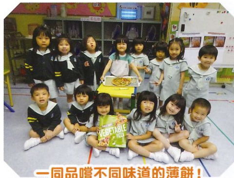
一同品嚐不同味道的薄餅!