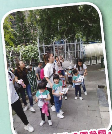
到香港動植物公園參觀。

學校安排N班兒童去嘉道理農場參觀是一個十分難忘的體驗。因N班的孩子年紀小小，便已經可以由學校跳出社區做一個連貫性的繪本學習，讓兒童體驗學習的樂趣，期待下一次的活動！