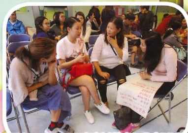
家長投入和認真地進行分組討論。