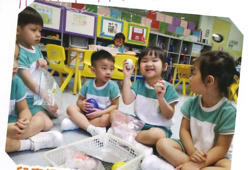
兒童搜集了不同的蛋回來介紹。