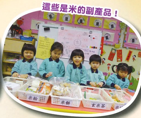
這些是米的副產品!