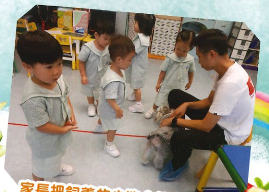
家長把飼養的小狗介紹給兒童。