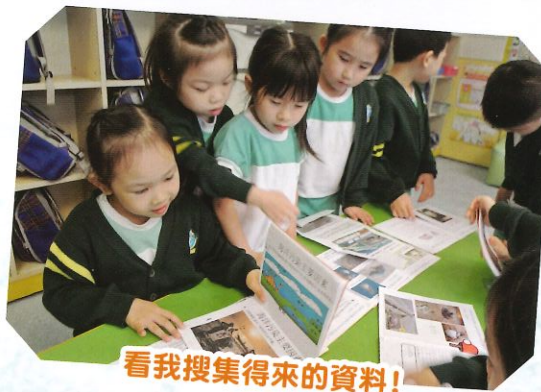
看我搜集得來的資料!