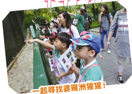
一起尋找婆羅洲猩猩!