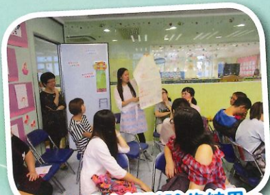
家長分享小組討論的結果。