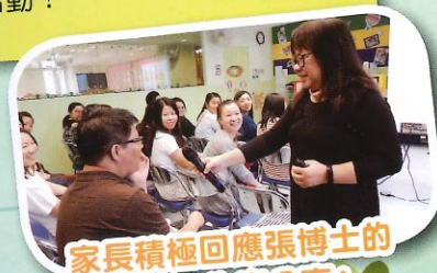
家長積極回應張博士的提問及作出分享！