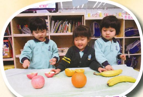
看!, 這些都是有益的水果!