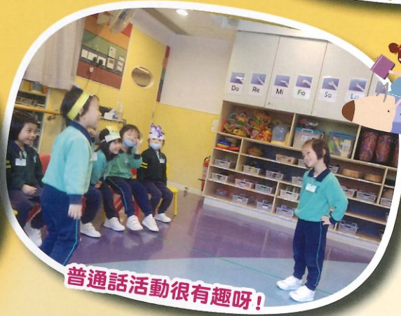
普通話活動很有趣呀！