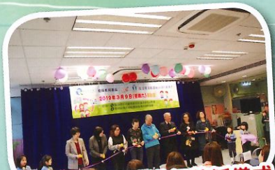
嘉賓們為啟動禮進行剪綵儀式。