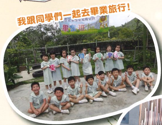
我跟同學們一起去畢業旅行！