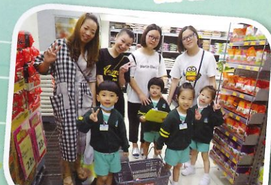
一起在超級市場購物好開心啊！