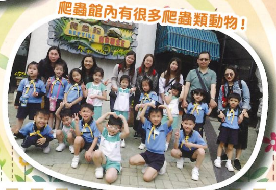
爬蟲館內有很多爬蟲類動物！