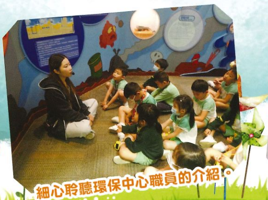
細心聆聽環保中心職員的介紹。