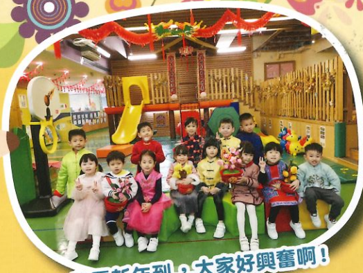
農曆新年到，大家好興奮啊！