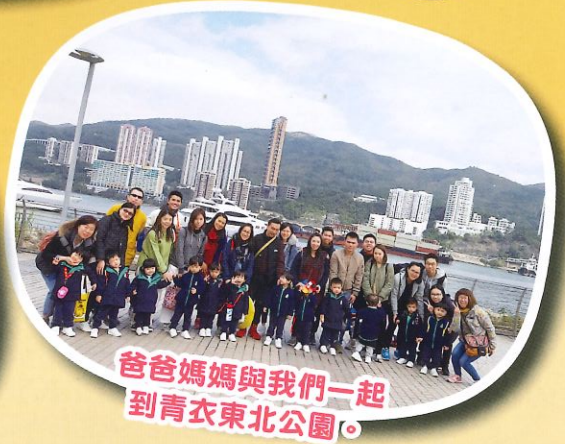
爸爸媽媽與我們一起 到青衣東北公園。