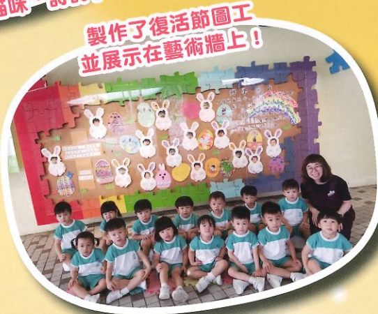
製作了復活節圖工 並展示在藝術牆上!