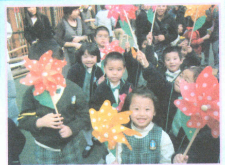
● 轉轉轉，我們到年宵市場買風車。