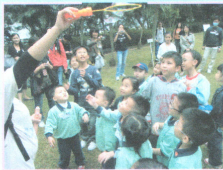
● 嘩！七彩泡泡真奇妙。