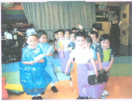
● 我們設計了一架小火車。