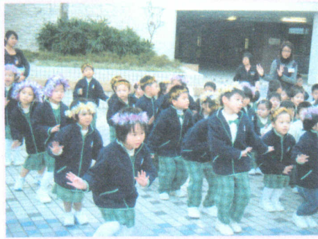
● 聖誕節到平台報佳音。