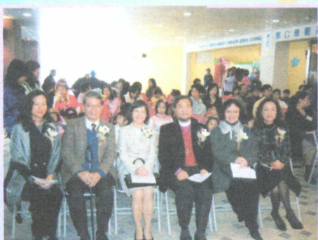
● 開幕典禮眾嘉賓拍照留念。