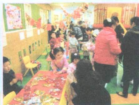
● 新年來到了，快來年宵市場辦年貨！