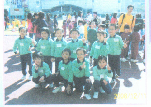
● 參加主恩小學運動會，努力、加油！