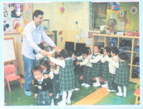
● 英語課堂時，與Mr. A 玩遊戲很開心！