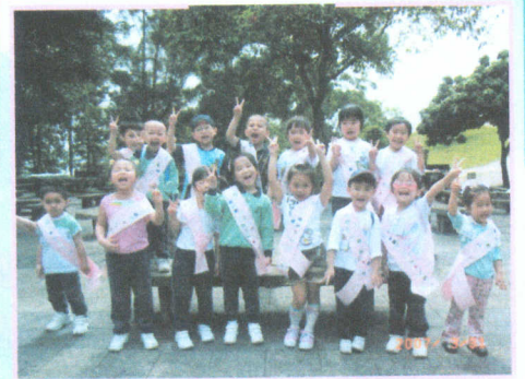
● 燒烤同樂日，真開心！