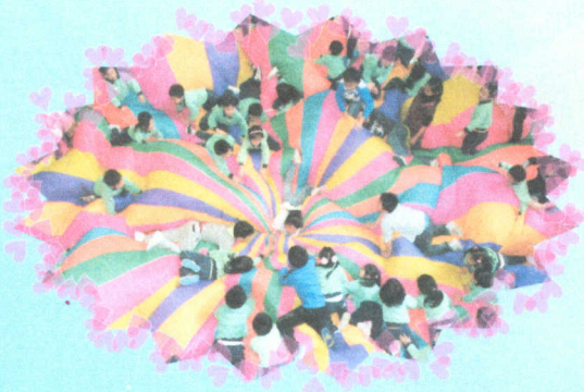
● 五周年大蛋糕真好味！