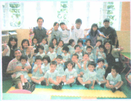
● 聖公會荊冕堂的牧師、傳道人、 哥哥姐姐和我們一起玩遊戲！