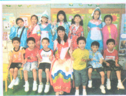
● 我們和老師一同穿上不同的 民族服裝，真有趣呢！