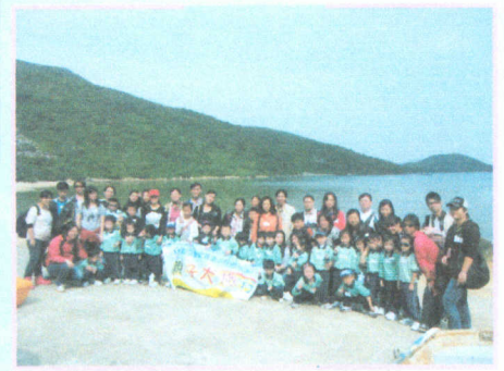
● 爸爸媽媽和我一起去看海下灣旅行。