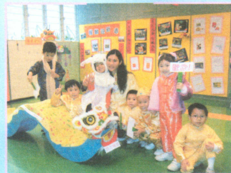
● 來來！快來看我們的作品。