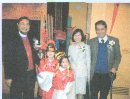
● 謝謝嘉賓欣賞我們的粵劇表演。