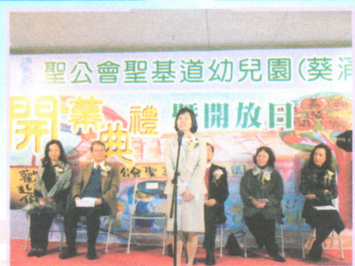
● 嘉賓為我們致開幕辭。