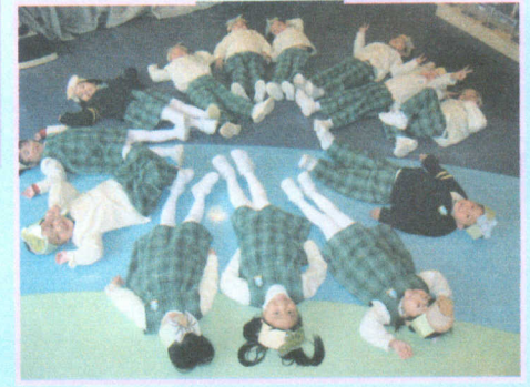
● 冬天來到了，動物要冬眠， 快快睡下吧！