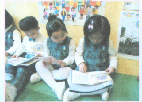
● 由三月開始，我們進行了閱讀袋(Reading Bag)計劃，期望能提升兒童的語文能力。