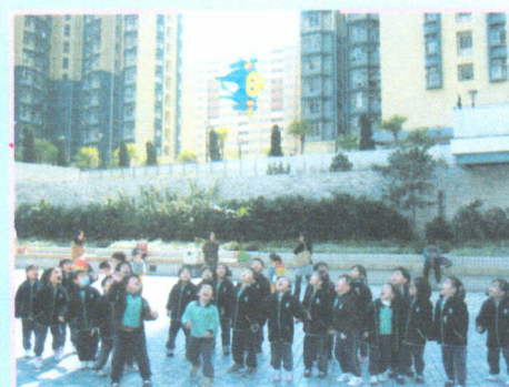
● 放風箏真有趣！風輕輕的吹， 送到天際，風箏飛得很高啊！