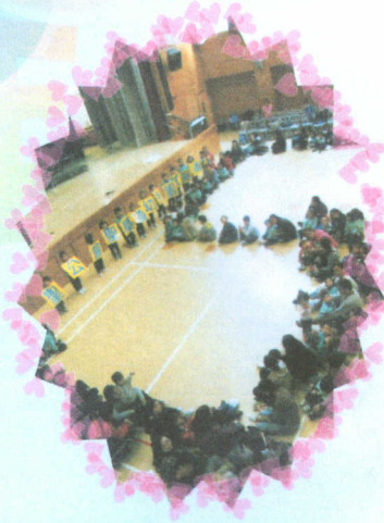
● 親子體智能同樂日，齊來慶祝五周年。