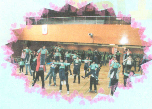
● 愛的舉重器能增進親子關係，真窩心！