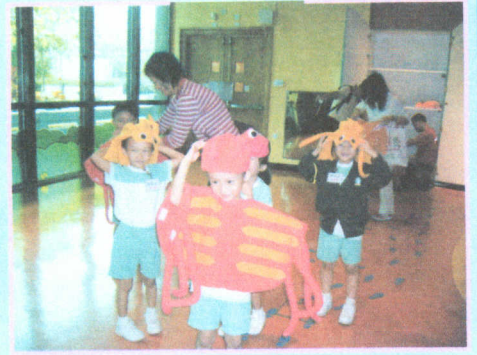
● 我們到香港文化博物館扮「蟹」呢！