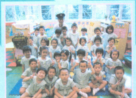
● 勇敢的消防員叔叔和我們分享 防火知識。