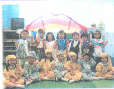
● 我們參演白雪公主的故事。