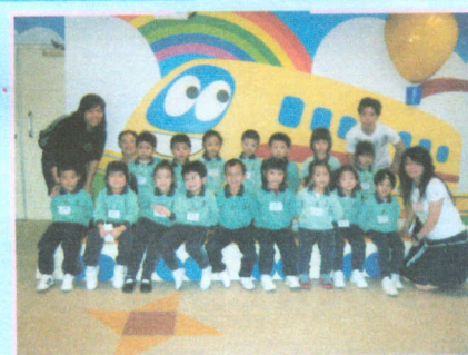
● 一、二、三，笑！牙齒真潔白。