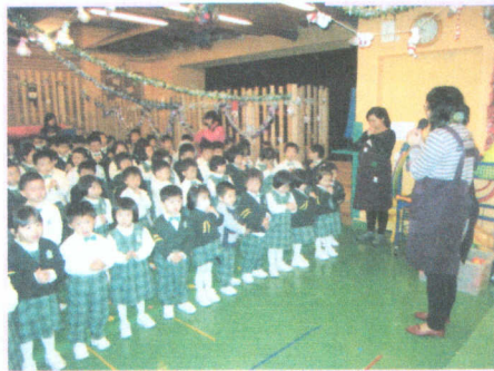
● 兒童崇拜中，我們安靜地祈禱。