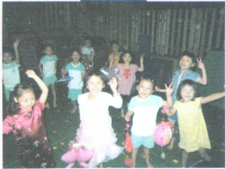
● 中秋節來到了，我們一起提花燈。