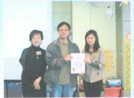
● 社工姑娘與家長分享管教子女及溝通的技巧與方法。