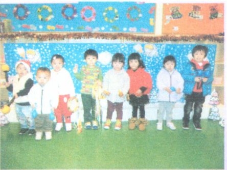
● 聖誕大樂隊：「普世歡騰，救主下降……。」