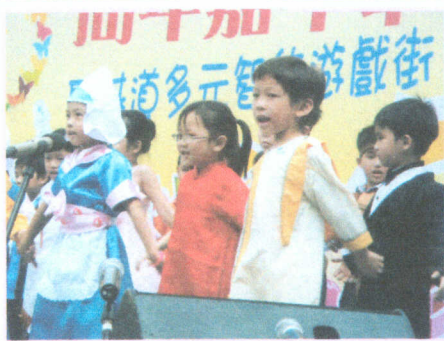
● 聖公會聖基道兒童院75周年嘉年華——看看我們的表演多精彩。