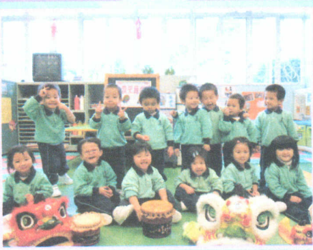
● 舞獅慶祝農曆新年真高興！Yeah！