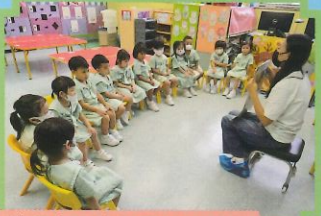
我們專心地學習普通話。