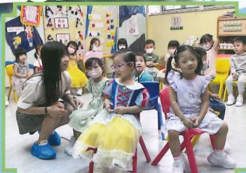
家長義工和我們玩遊戲。