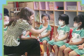
Hello, give me five!