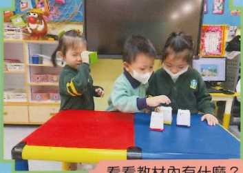
看看教材內有什麼？