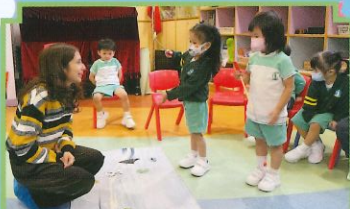
Let's play fishing