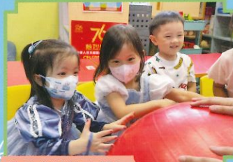
生日會遊戲真開心