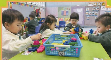
和同伴一起玩耍，真開心！