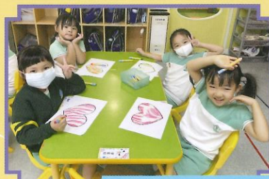
我要將愛心送給家人呢！