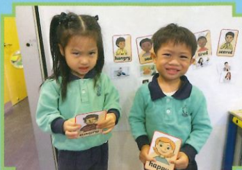
猜一猜，我們在扮演什麼表情呢？