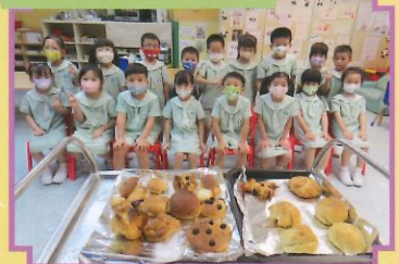
請品嚐我們製作的麵包。