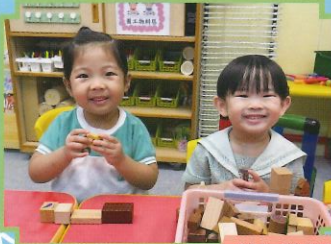
我喜歡和朋友一同玩耍。