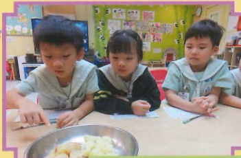
探索不同的烹調方法。