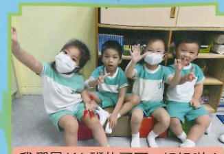
我們是K1班的哥哥、姐姐啦！