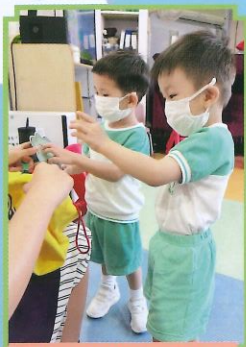
認真地參與課堂活動。