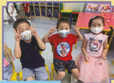
我有很多好朋友啊！