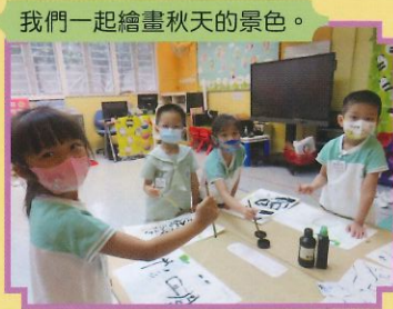
我們一起繪畫秋天的景色。