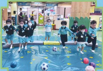
看！我們的棉球拋得很遠啊！